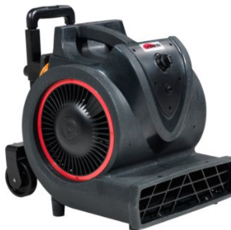
Zdjęcia produktów mają charakter poglądowy