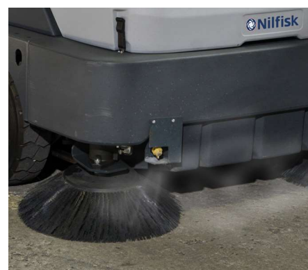
System DustGuard™ (standard w wersji MAXI) efektywnie kontroluje unoszący się pył poprzez wytwarzanie mgiełki wodnej zraszającej miotły