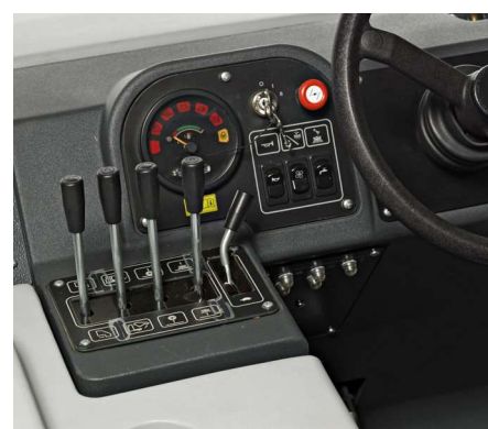
Przejrzyste i łatwy w obsłudze panel kontrolny