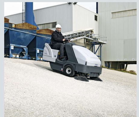
Maksymalny stopień pokonywania wzniesień wynosi 25%