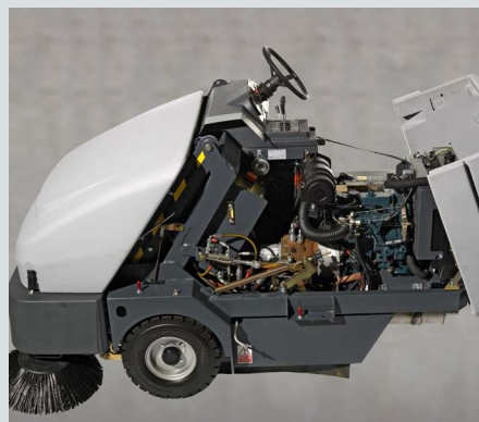
System MaxAccess™ zapewnia szybki i łatwy dostęp do elementów maszyny ułatwiający serwisowanie