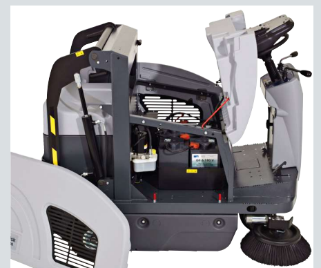
Do wymiany miotły i filtra nie są potrzebne żadne narzędzia, co ułatwia obsługę i konserwację maszyny