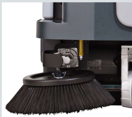
System DustGuard™ (opcja) z dyszami, które natryskują drobną mgiełkę na miotły - redukuje ilość pyłu powstającego podczas pracy