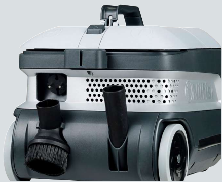
Przemysłowy schowek na akcesoria