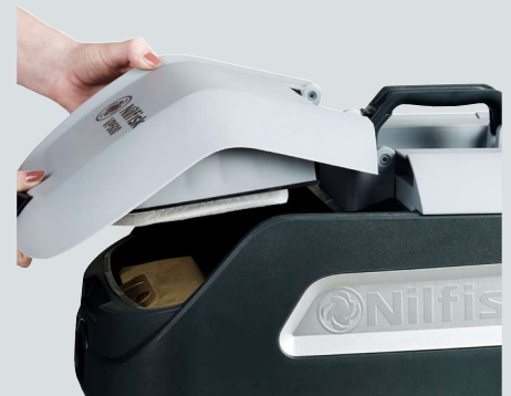
Magnetyczne zaczepy pewnie i solidnie utrzymują pokrywę