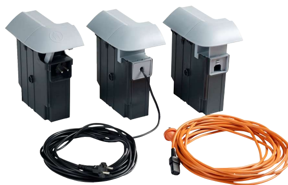
Moduły z różnymi rodzajami mocowania przewodu zasilającego: zwijany, mocowany na stałe i odłączany